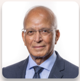
Altaf Hussain AS Ceidwadwyr Cymreig