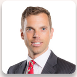
Ken Skates AS Llafur Cymru